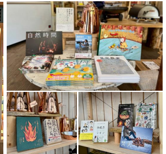
▲アウトドア施設事例