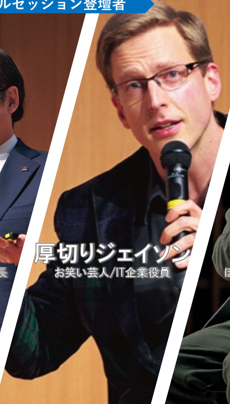
厚切りジェイソン お笑い芸人/IT企業役員