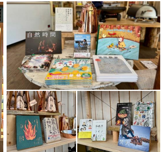
▲アウトドア施設事例