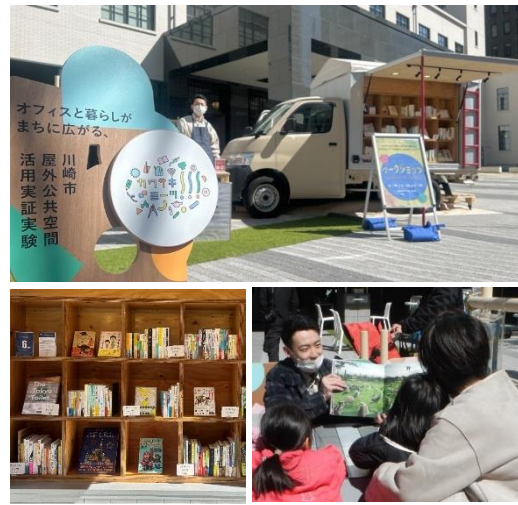
▲川崎市『カワサキミーツ!!!』