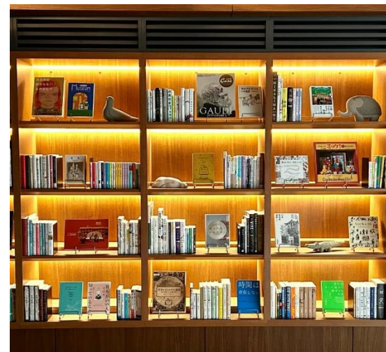
▲マンションライブラリ事例